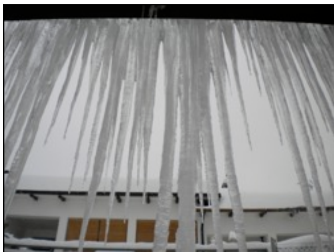
monte san pietro, inverno 2012

Il numero 0 della newsletter riportava per intero il progetto Insieme per la cultura e rilevava due momenti di prospettiva: la realizzazione di un Cartellone delle attività culturali a Monte San Pietro autonomamente programmate dalle associazioni e l'avvio di nuove progettualità anche professionalmente qualificate per settori di interesse.